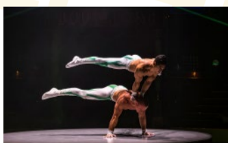
Duo A & A – Handstand-Akrobatik